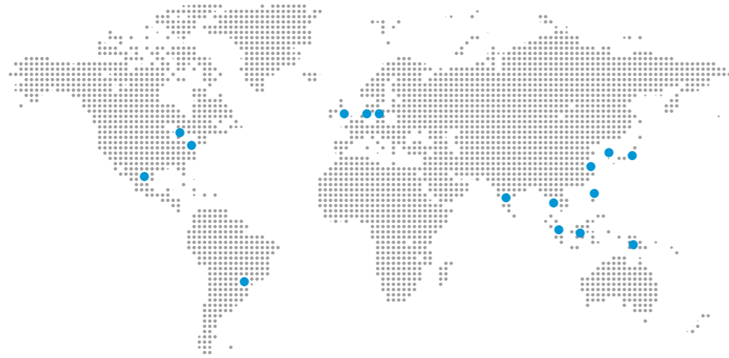
● NORGLIDE® 和 RENCOL® 地点

Saint-Gobain Performance Plastics 美国·密歇根州底特律市 电话: (1) 734 744 5051 传真: (1) 734 744 5053