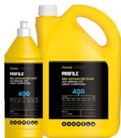
PRA 400 高级液态抛光剂