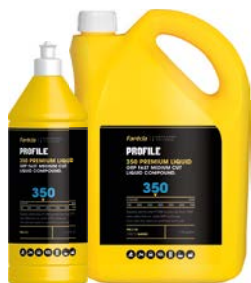
PRP 350 GRP 快速中粗液态抛光剂