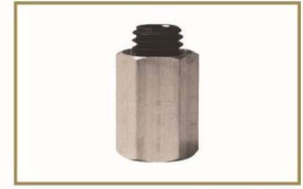
为8寸双面羊毛盘准备的转接头

GMA014 (14mm 接头 ) GMA058 (5/8" 接头 ) GMA016 (16mm 接头 )