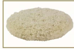
G Mop 8寸曲边羊毛盘-双面