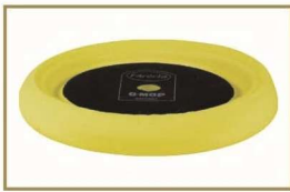
G Mop 8" Yellow Compounding Pad GMC812