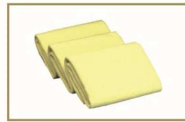
Farécla 抹蜡布 FC-3 (3 x cloths)