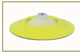
为8寸羊毛盘准备的G Mop 柔性后托盘 GMB814 (14mm 接头 ) GMB858 (5/8" 接头 ) GMB816 (16mm 接头 )

GMA014 (14mm 接头 ) GMA058 (5/8" 接头 ) GMA016 (16mm 接头 )