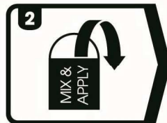
使用前充分搅拌产品并且取用少量产品至抛光盘表面