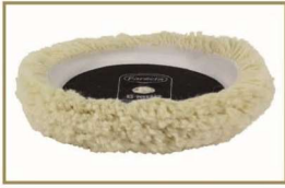
G Mop 8寸曲边羊毛盘-单面