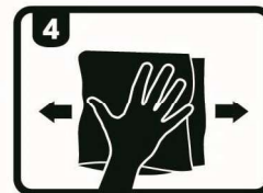
抛光结束，用Farecla抹蜡布擦拭干净