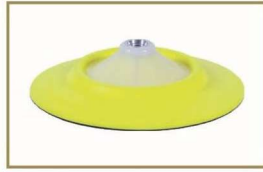
为8寸羊毛盘准备的G Mop 柔性后托盘 GMB814 (14mm 接头 ) GMB858 (5/8" 接头 ) GMB816 (16mm 接头 )